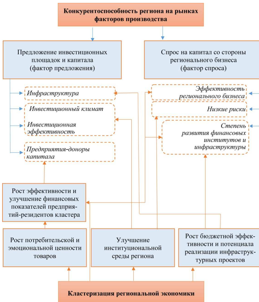
Рисунок 3.2 – Модель воздействия кластеризации на конкурентоспособность региона (факторы производства)

Модель влияния кластеризации на инновационную составляющую региональной конкурентоспособности приведена на рисунке 3.2.