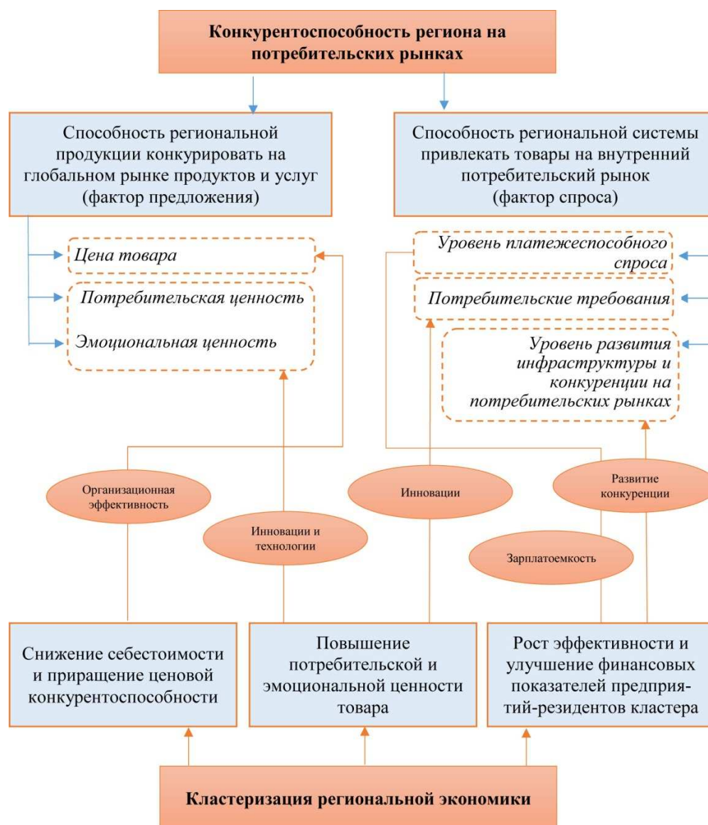
Рисунок 3.1 – Модель воздействия кластеризации на конкурентоспособность региона (потребительские рынки и товары)

В условиях глобализации мирового экономического пространства эти два фактора будут играть первостепенную роль в процессах специализации и дифференциации региональной экономики. Региональная система получит возможность усиливать специализацию и наращивать свое конкурентное преимущество на глобальных рынках.