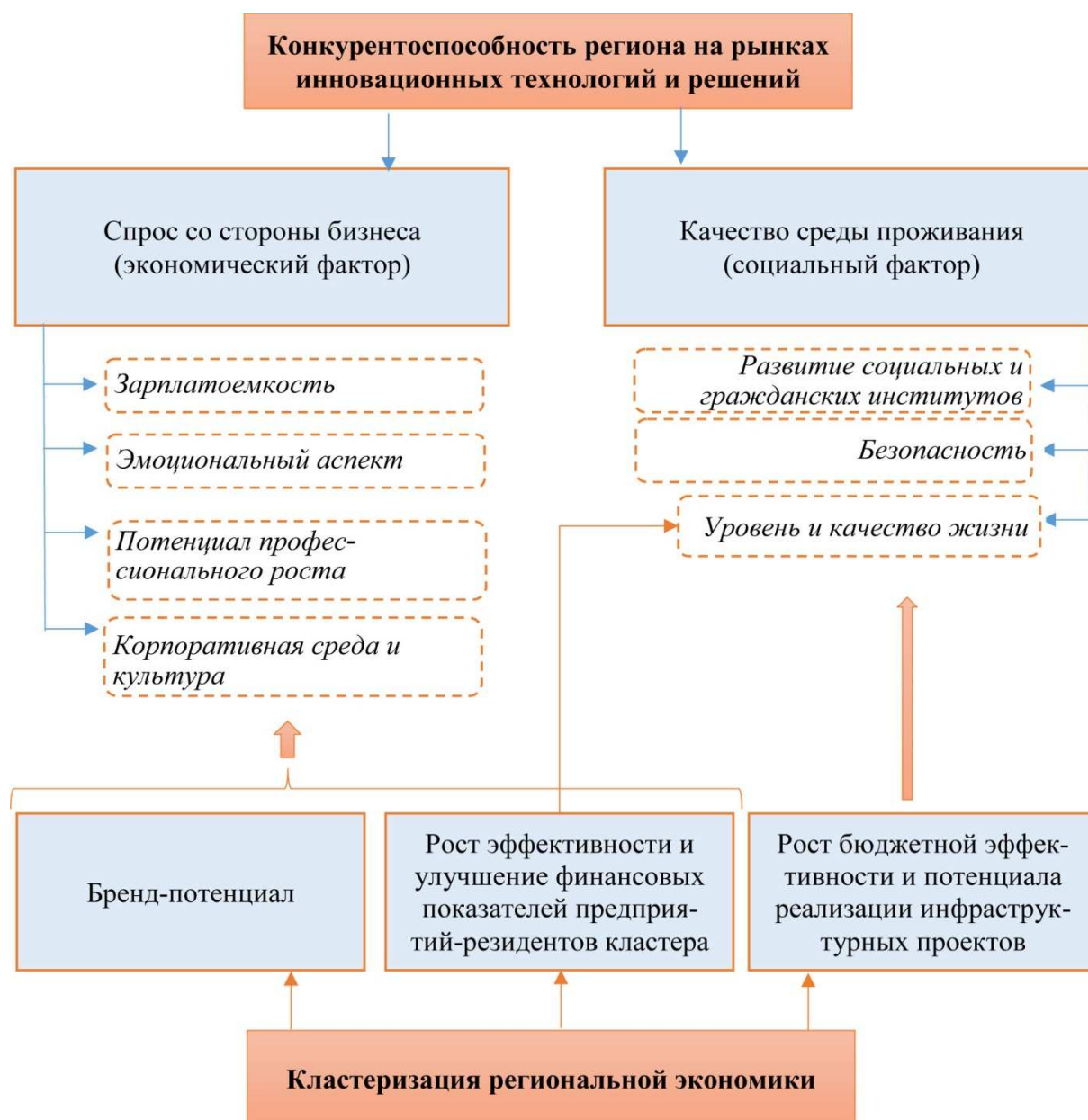
Рисунок 3.4 – Модель воздействия кластеризации на конкурентоспособность региона (факторы рынка труда)

Из данного рисунка можно увидеть, что конкурентоспособность региона как территории для проживания высококвалифицированного персонала проявляется также в двух направлениях. С одной стороны – это частные факторы, которые создаются на уровне регионального бизнеса – зарплатоемкость, потенциал профессионального роста, эмоциональные аспекты, связанные с бренд-потенциалом предприятия (одно дело работать