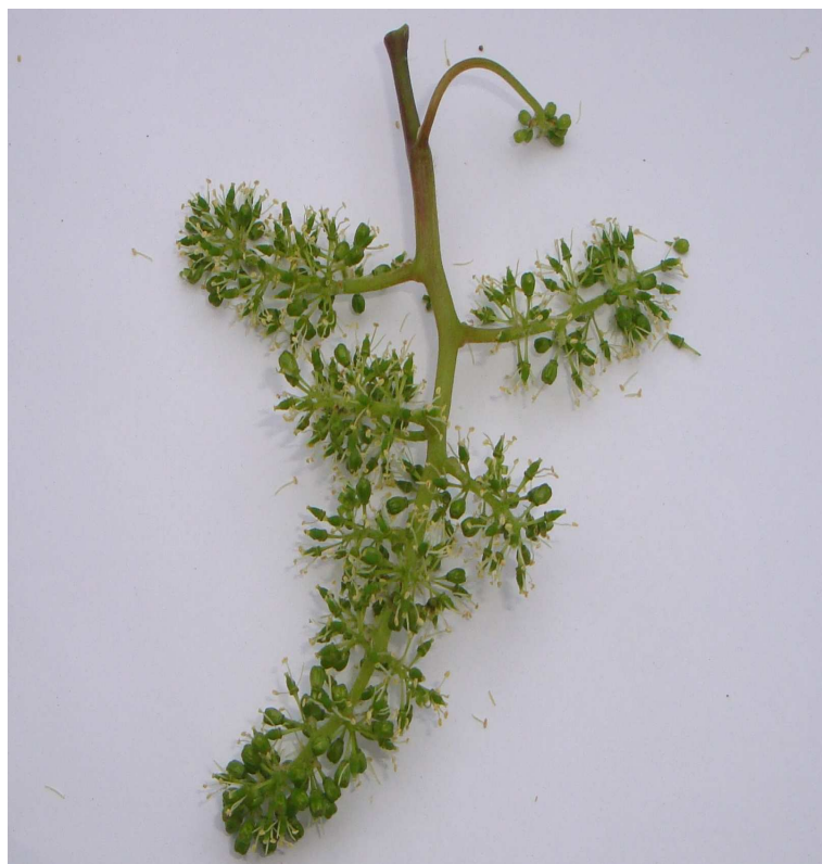
Рис. 7. Соцветие сорта винограда Агапи