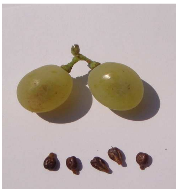
Рис. 8-10. Грозди, ягоды и семена сорта винограда Агапи