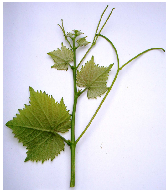
Рис. 1-2. Верхушка молодого побега сорта винограда Агапи

016 - распределение усиков на побеге: 1 - 2 или меньше;