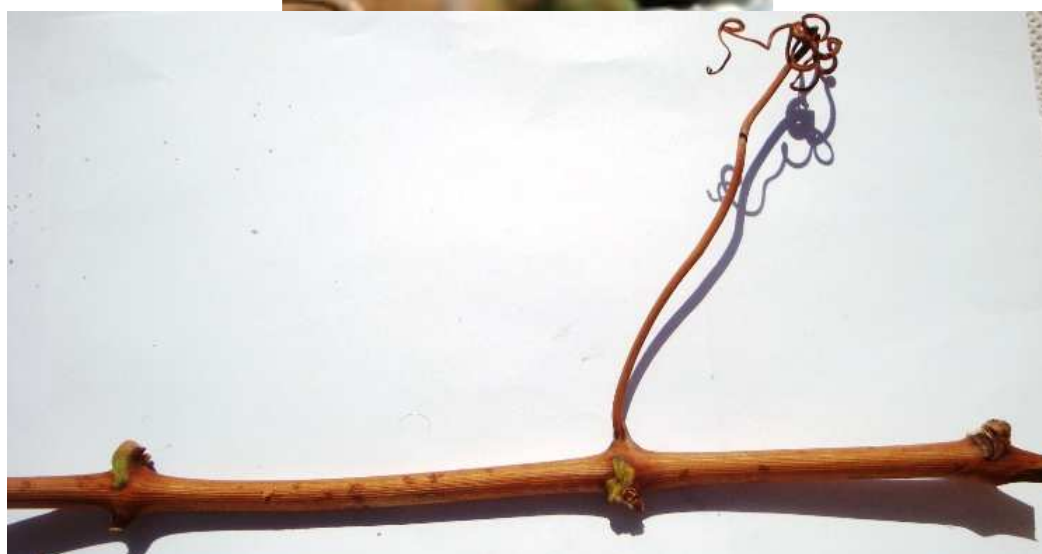
Рис. 11-12. Распустившийся глазок и одревесневший побег сорта винограда Агапи