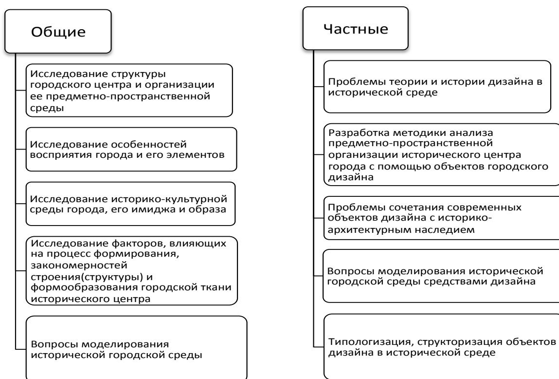
Рис. 4. Классификация теоретических направлений решения проблемы

Каждый из авторов рассматривает проблему под своим углом зрения, но проведенный анализ существующих теоретических исследований позволил выявить два основных направления, решающих общие и частные вопросы (рис. 4):