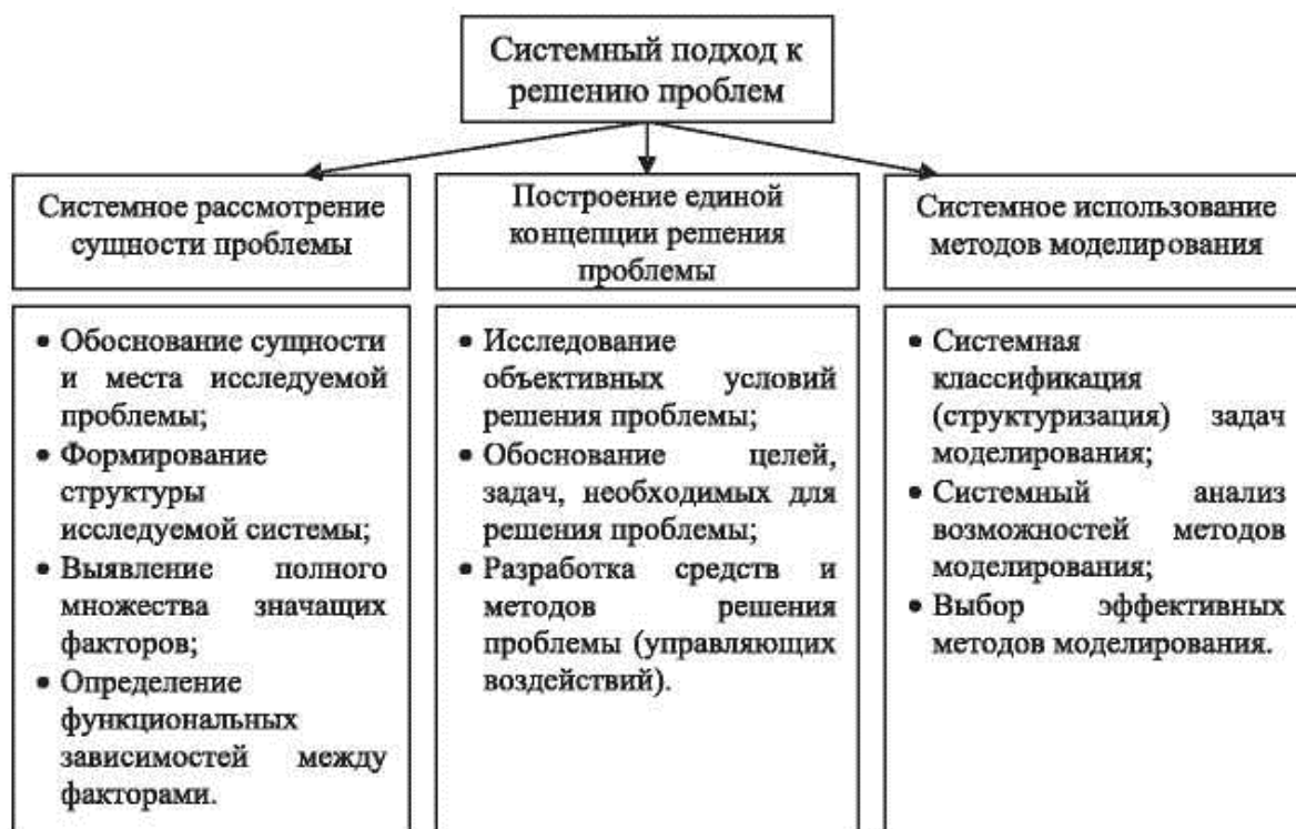
Рис. 2. Содержание системного подхода к решению проблем.