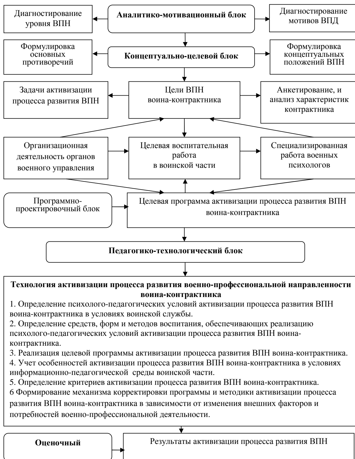
Рис. 2. Модель активизации процесса развития военно-профессиональной направленности воина-контрактника

Применение настоящей модели требует активного участия в ее реализации военных психологов. Их специализированная деятельность