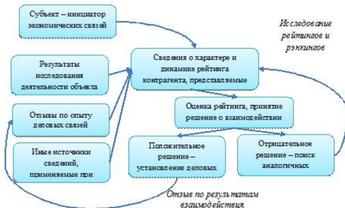
Рисунок 2 – Предлагаемая схема пользования рейтингом контрагента

рейтингов. К сожалению, отечественные ученые этому уделяют явно недостаточно внимания [3]. А ведь рейтинг способен оказать существенное влияние на решение вышеуказанных проблем, в том числе связанных со злоупотреблениями. Предполагаемая схема пользования независимой оценкой представлена на рисунке 2.