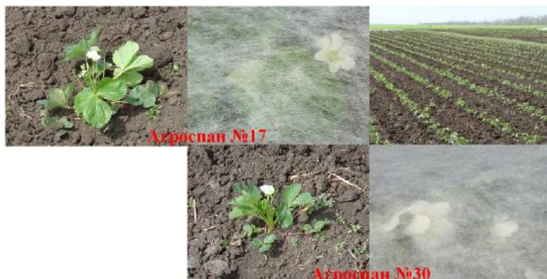
Рисунок 4 – Развитие растений земляники сорта Альба в зависимости от условий выращивания на 04.05.2011г.

При прохождении контрольными растениями (неукрытыми) фенофазы «выдвижение соцветий» (04.05.2011) земляника в варианте Агроспан №17 завершает цветение, переходит к активному образованию усов, в варианте Агроспан №30 – отметили массовое цветение (рис. 4). Установили, что разница между укрытыми вариантами и контролем в сроках прохож-