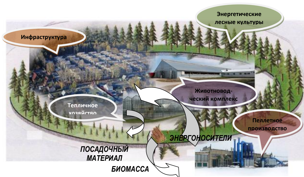
Рисунок 1 – Схема территориального агролесоводственного биоэнергетического комплекса

Основным производством в территориальном биоэнергетическом комплексе является производство энергоносителей на экспорт – обычных или термообработанных топливных гранул (простых или угольных пеллет). Главными вспомогательными производствами являются тепличное хозяйство, где выращивается посадочный материал для создания энергетических лесных культур, а также сельскохозяйственная продукция, животноводческие фермы (при наличии доступных кормовых ресурсов), жилищно-коммунальное хозяйство.