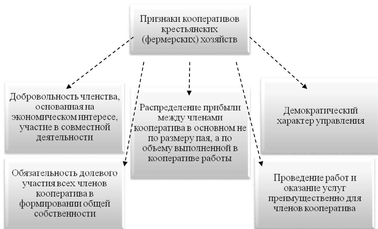
Рисунок 1. Признаки кооперативов крестьянских (фермерских) хозяйств

В условиях экономической нестабильности объединение малых форм хозяйствования в кооперативные союзы становится единственной возможностью перехода от выживания к развитию [10].