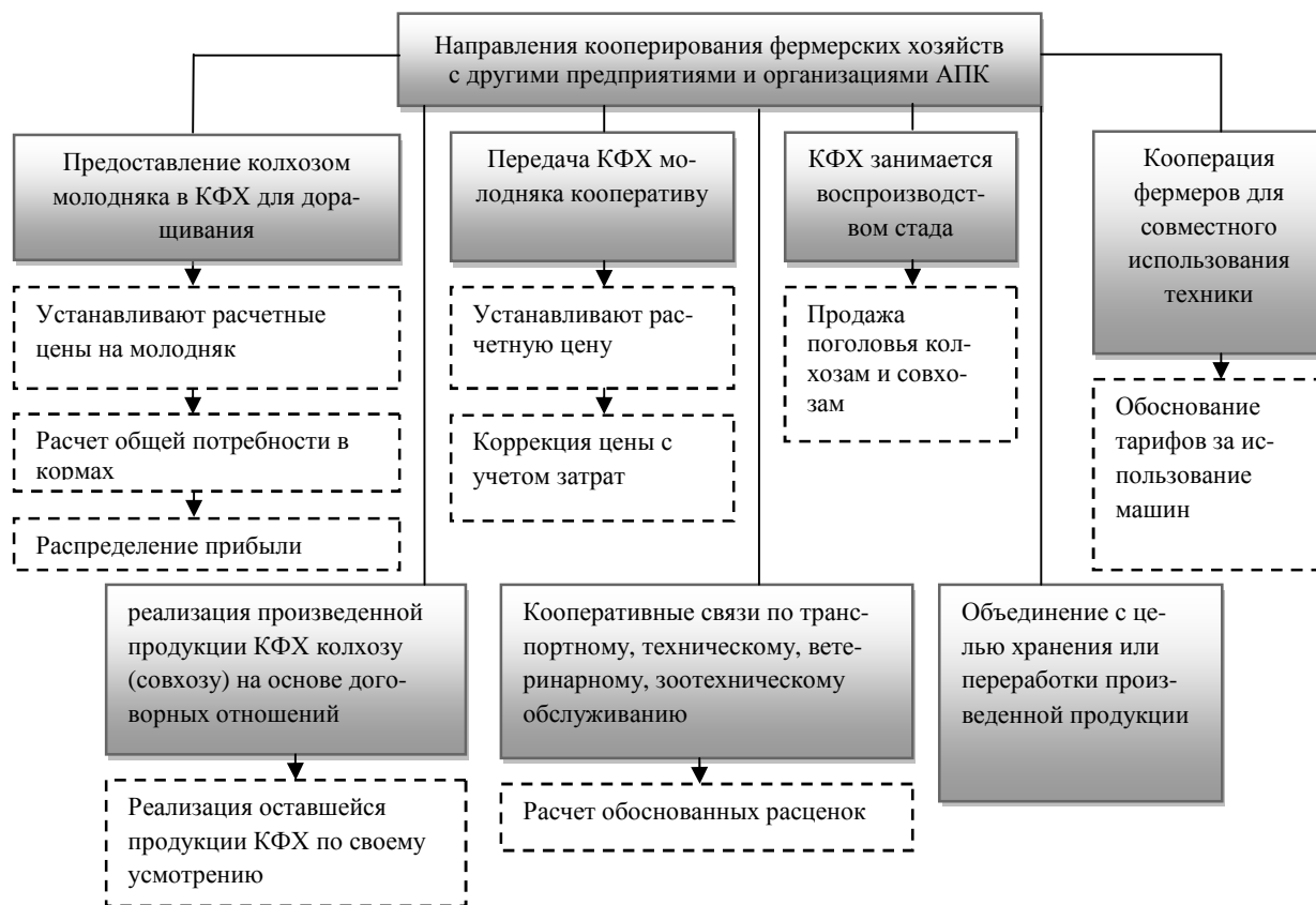
Рисунок 2. Формы фермерской кооперации

В сельском хозяйстве наиболее распространена производственная кооперация, тогда как потребительская кооперация, вертикальная кооперация только начинают свое развитие. А.В. Чаянова отмечал: «...поскольку организационное овладение процессами сельскохозяйственного производства возможно только при замене распыленного крестьянского хозяйства формами производства концентрированного, мы должны всячески развивать те процессы деревенской жизни, которые ведут к этой концентрации» [11].