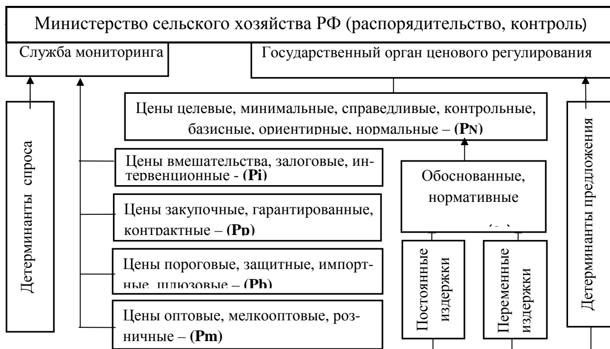
Рисунок 2 - Модель ценового регулирования зернового рынка

Рассмотренная система цен государственного регулирования рынка зерна составляет основу предлагаемой нами модели ценового регулирования зернового рынка (рисунок 2) и обобщенный алгоритм принятия решений по регулированию ценовых деформаций зернового рынка (рисунок 3).