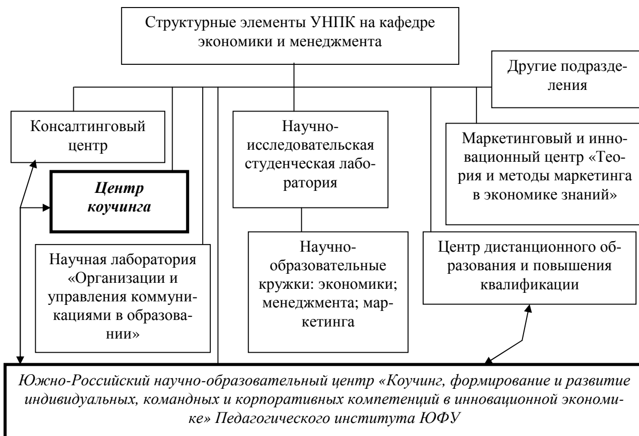
Рисунок 2 - Элементы УНПК и инновационной инфраструктуры университета, реализованные на кафедре экономики и менеджмента

Новыми структурными элементами в системе подготовки, переподготовки и повышения квалификации кадров явились: учебно-научно-производственный комплекс кафедры (рис. 2); научно-образовательный центр «Коучинг, формирование и развитие индивидуальных, командных и корпоративных компетенций в инновационной экономике».