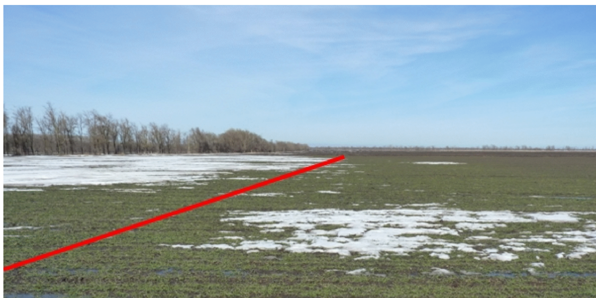
Рисунок 3. Линия снегонакопления с наветренной стороны лесной полосы

Таким образом, применение информационных технологий при оперативном полевом обследовании земель показало возможность фотофиксации состояния поверхности почвы, а также определения потерь почвы сразу, через несколько часов после ветровой эрозии. Также информационные технологии позволяют исследовать обширные