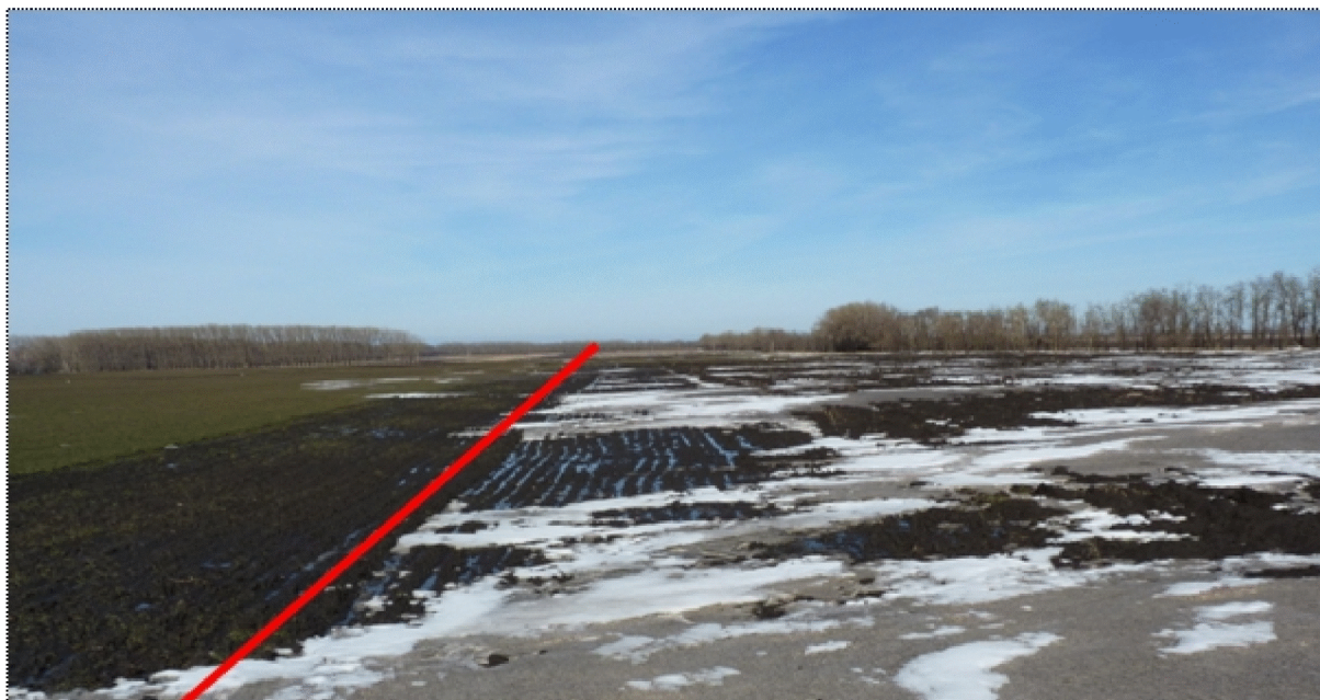
Рисунок 2. Линия снегонакопления на подветренной стороне лесной полосы