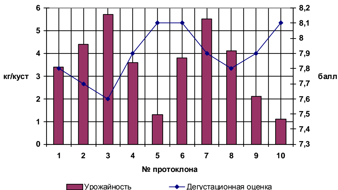
Рисунок 1. – Зависимость дегустационной оценки от урожайности винограда.

В результате исследований установлено, что во всех опытных виноматериалах в высоких концентрациях присутствовали такие вещества как ацетальдегид, 2,3-бутиленгликоль, метанол, изоамиловый спирт, уксусная кислота, которые являются продуктами вторичного брожения. Ароматические вещества – лимонен, метилацеталь, диацетил, ацетоин, фурфурол, сложные эфиры, сивушные масла, альдегиды содержались в весьма малых количествах.