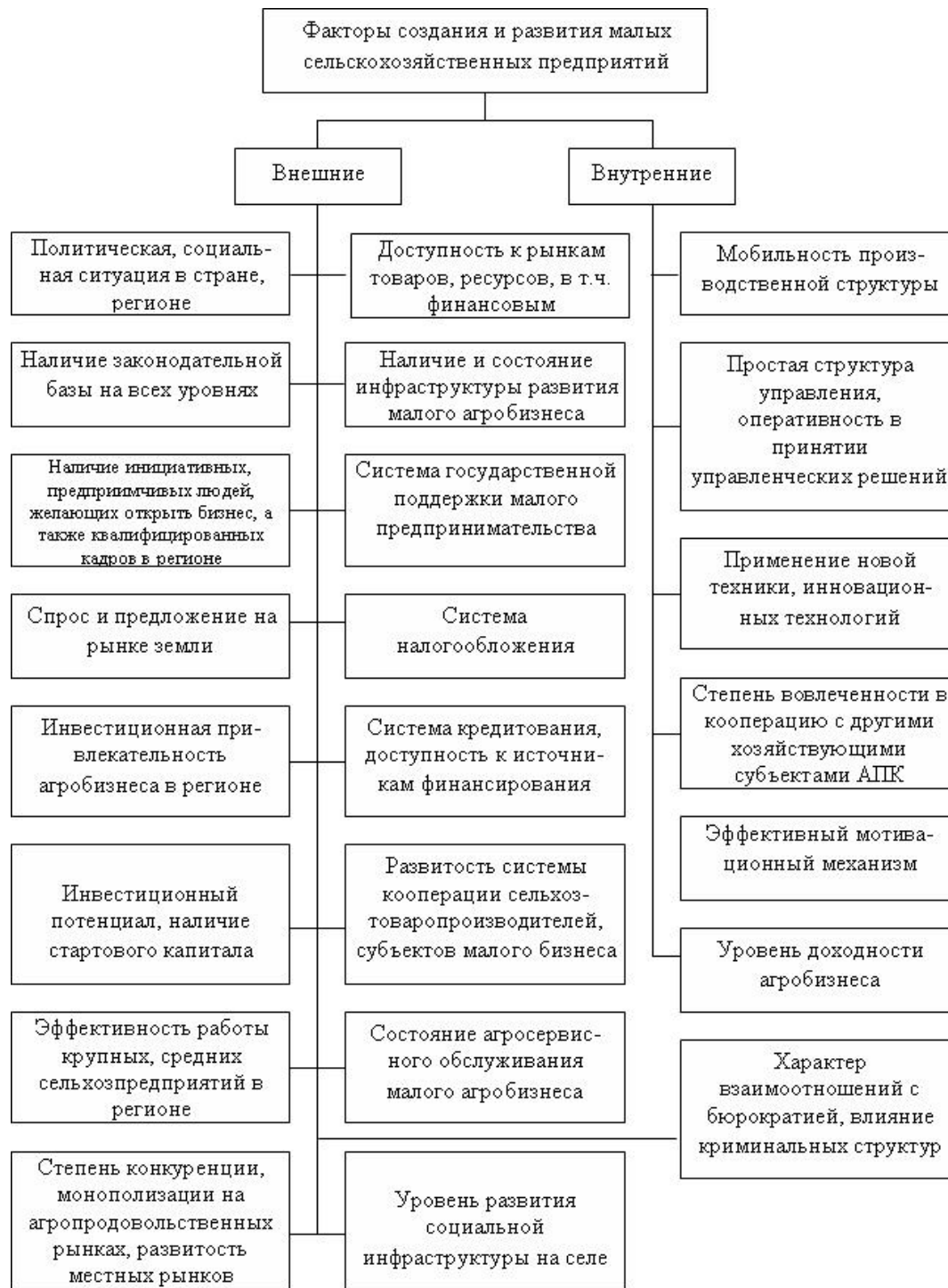
Рисунок 2 – Факторы создания и развития малых сельскохозяйственных предприятий