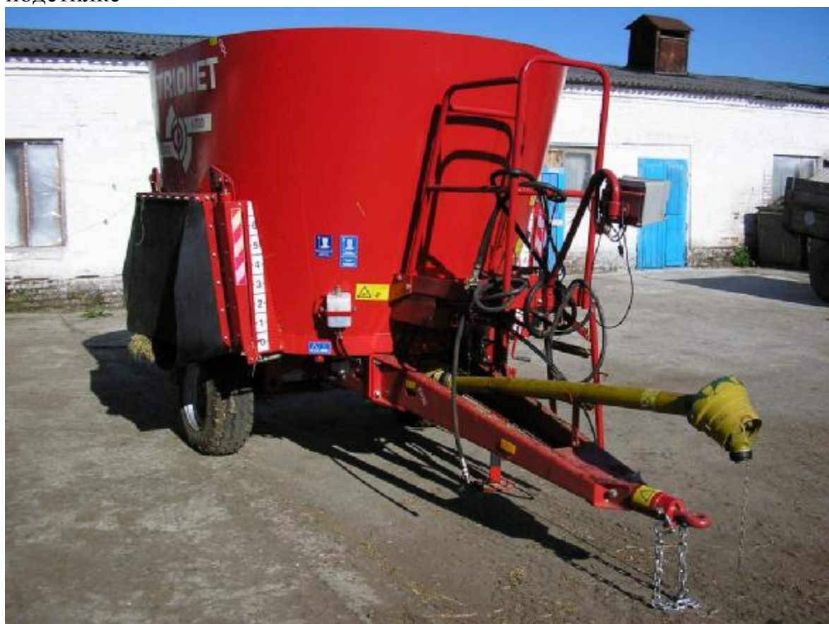
Рис. 4. Кормораздатчик-смеситель