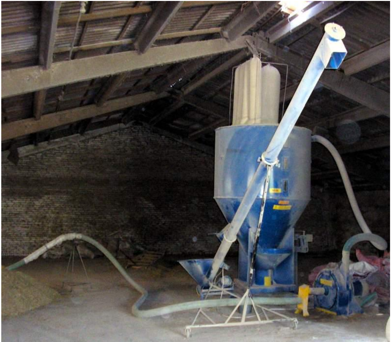
Рис. 1. Измельчающе-смешивающий агрегат с весовым дозатором УПСК-1.00.ФО

С рождения и до 2-х месячного возраста бычков содержали в индивидуальных домиках с выгульными площадками конструкции СКНИИЖ (рисунок 2).