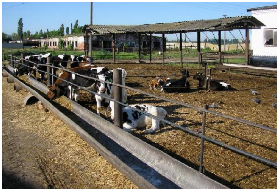
Рис. 3. Содержание телят на 3–6 месяцах жизни: групповое на глубокой подстилке