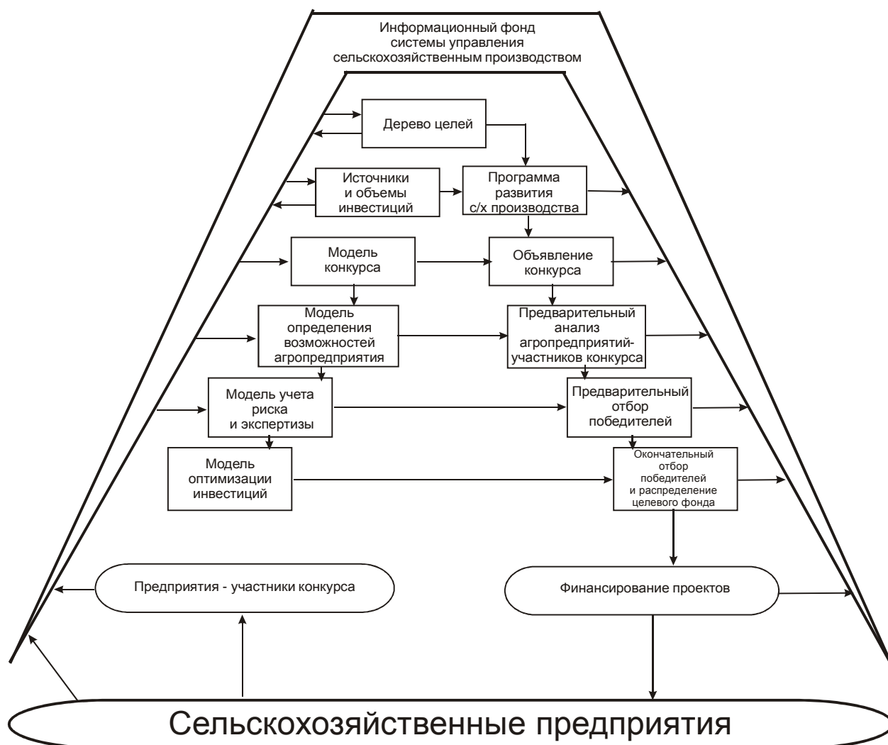
Рис. 3. Взаимосвязь моделей и фаз управления распределением инвестиций

На основе информации о потребностях в сельскохозяйственной продукции и состоянии сельскохозяйственного производства региона разрабатывается дерево целей системы управления. На основе выявленных целей и финансовых возможностей (источники и объемы инвестиций) разрабатывается программа развития сельскохозяйственного производства, содержащая портфель инвестиционных проектов. Инвестиционные проекты выставляются на конкурс по их выполнению. Объявление конкурса агропредприятий на выполнение инвестиционных проектов производится на основе модели, разрабатываемой аппаратом управления системы. Предприятия, подавшие заявки на участие в конкурсе, проходят предварительные экспертизу и отбор с помощью моделей и методик определения их возможностей, учета риска и экспертной оценки. Одновременно производится корректировка портфеля инвестиционных проектов, состоящая в возможном агрегировании или декомпозиции некоторых из них. На заключительном этапе на основе модели оптимизации