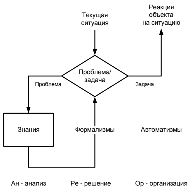
Рис. 1. Схема деления вопросов, порождаемых ситуацией, на проблемы и задачи

На рисунке 1 представлена схема разделения вопросов, порождаемых ситуацией, на проблемы и задачи. Она подтверждает тезис о том, что для решения задач можно вполне обойтись наличными знаниями. Однако решение проблемы предполагает выход из круга старых понятий, то есть выработку качественно новых знаний (их приращение).